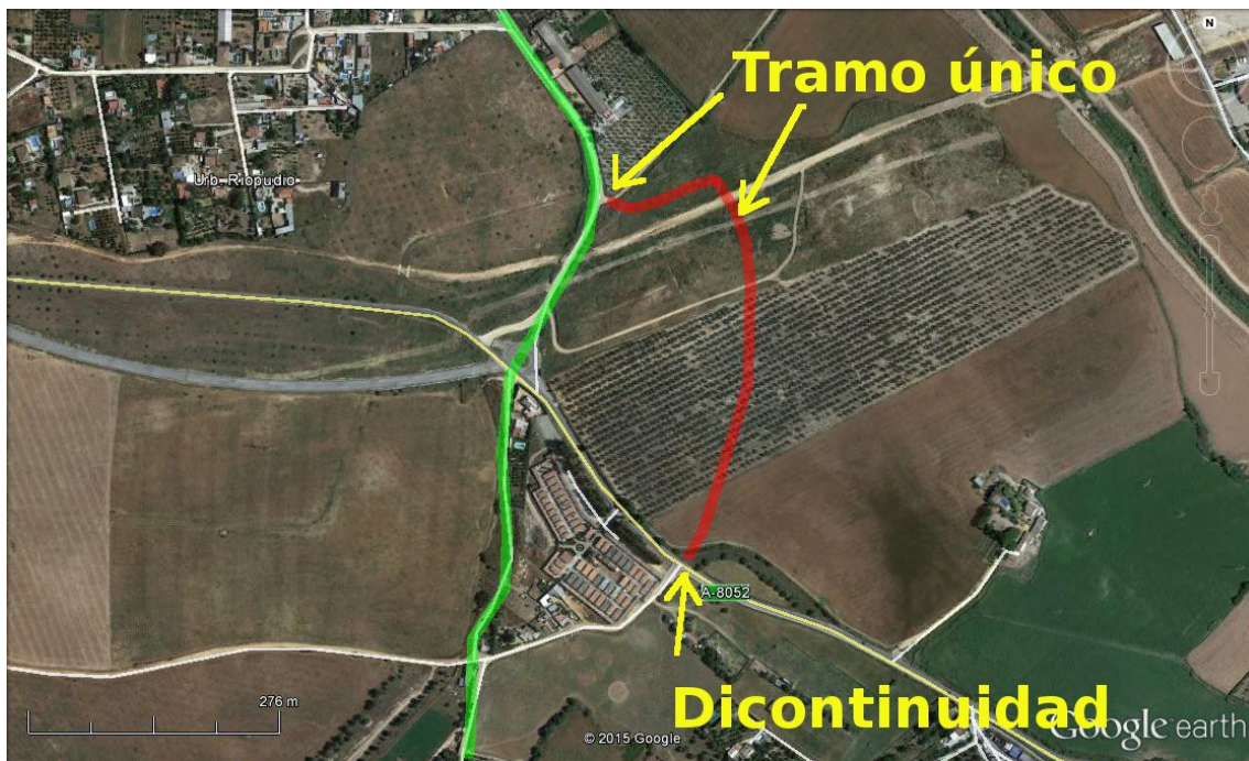
En verde el trazado original y en rojo el trazado resultante