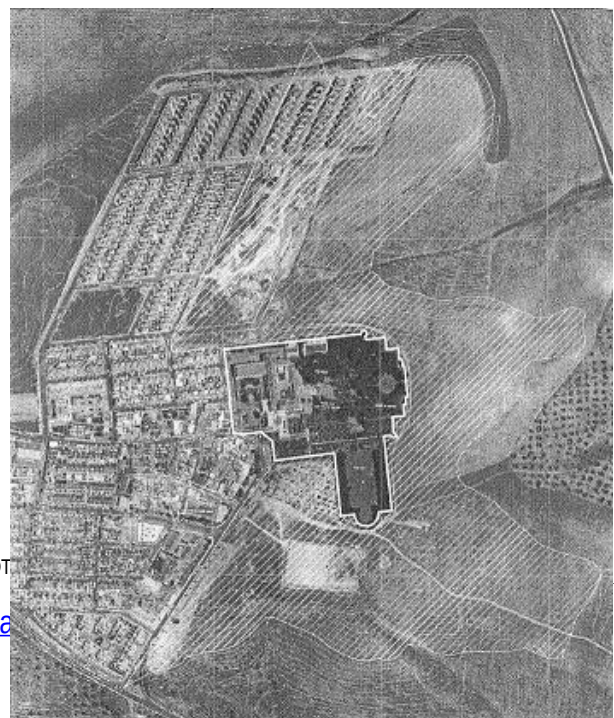
Entorno protegido del BIC (rayado)

Además, la construcción en esos suelos, necesitará aterrazamientos y rellenos (la parcela propuesta por el PAU, se encuentra en su límite norte en la línea de nivel de 122,64 metros y su límite sureste se encuentra en la línea de nivel de 102 metros, es decir, una diferencia de 20,64 metros), lo que aumentará el