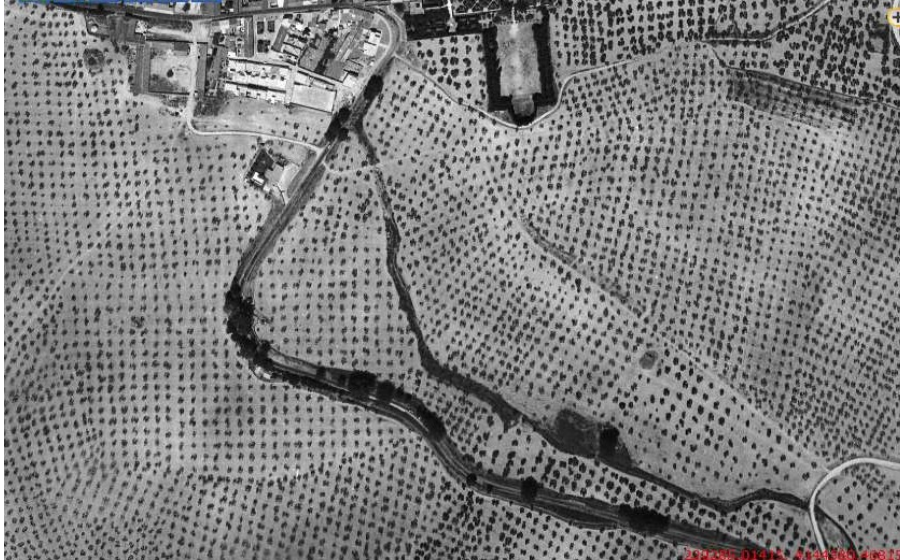
Arriba ortofoto de 1977-78 del Portal IDEA, donde se observa el trazado del arroyo sobre el campo de olivos. Abajo Ortofoto de 2008-2009, con el trazado del Arroyo Alfileres en azul.

Por la diagonal de la parcela discurre el Arroyo Alfileres, como se puede observar en la ortofoto de 1977-78 y la ortofoto de 2008-2009, del Portal IDEA de la Junta de Andalucía.