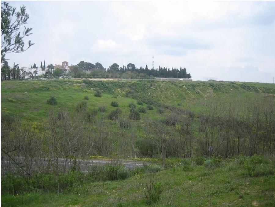
Foto tomada desde el sur. En primer término la carretera. Al fondo el BIC. Desde el centro de la foto hacia la derecha se distingue la línea de vegetación que es el curso principal del arroyo Alfileres. Se distingue también el soterramiento de la parte más próxima al BIC, mediante un relleno de escombros que alcanza una considerable altura.

Además, el PAU dice que el propietario de la totalidad de los terrenos es el Ayuntamiento, sin que aparezca delimitado el Dominio Público Hidráulico, ni aparezca la Administración del Estado (art. 95 Ley de Aguas) como titular de dichos suelos.