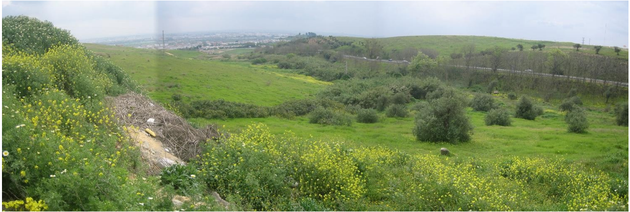
Foto tomada desde el norte, sobre los escombros que cubren el cauce, hacia el este. Al fondo Sevilla. En el centro de la panorámica se distingue la línea de vegetación en torno al cauce principal del arroyo Alfileres.