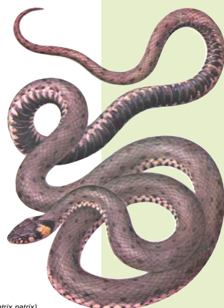
Culebra de collar ( Natrix natrix )

La importancia natural y paisajística de este espacio reside, además de en sus valores actuales, en su potencial de futuro, por la existencia de un elemento natural potente (el arroyo y sus márgenes), por estar todavía poco afectado por la urbanización y por su situación estratégica tanto en el sistema natural de su entorno como respecto al sistema urbano. Ello lo hace idóneo para la aplicación de políticas de restauración ambiental y paisajística, encaminadas a recuperar en lo posible la vegetación y la fauna autóctona, a conservar el paisaje tradicional del Aljarafe y a dotar de espacios libres a la población.